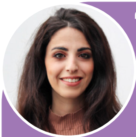
เอเลียย์

“ปีนี้เป็นปีที่เพิ่มคุณค่าทางจิตวิญญาณและเปิดมุมมองของฉันให้กว้างขึ้นจากการที่ได้พบกับผู้คนใหม่ ๆ และค้นพบความมหัศจรรย์ของสหราชอาณาจักร ตอนนี้ฉันรู้แล้วว่าโลกกว้างขนาดไหน และไม่มีขอบเขตใด ๆ มาขวางกั้นความมุ่งมั่นของเราได้เมื่อความสำเร็จของเราจุดประกายขึ้น